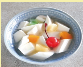
杏仁豆腐 1個 500円