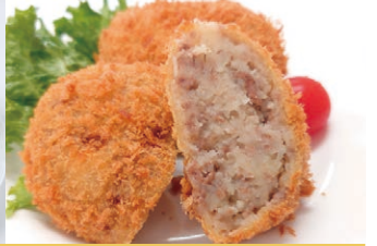
⑧自家製ポテトコロッケ (2個)