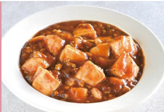
⑨四川麻婆豆腐 (約2人前)