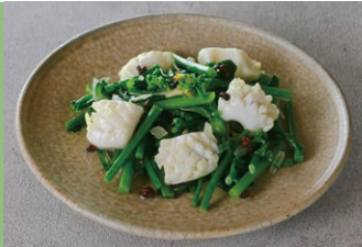
⑬イカと小松菜の山椒油和え