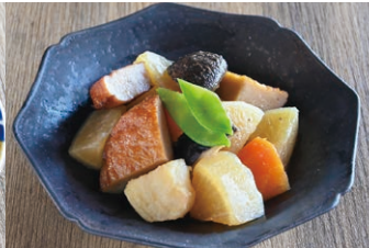
⑫さつま揚げと大根の煮物 (約2人前)