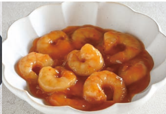
②海老チリソース (約2人前)