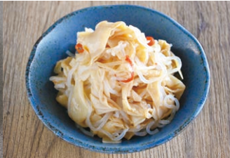
⑭湯葉筍と白滝のピリ辛炒め