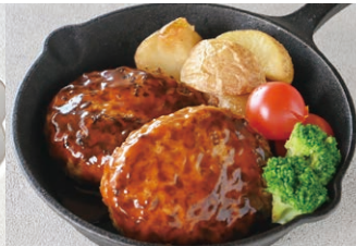
③ハンバーグデミグラスソース (2個)