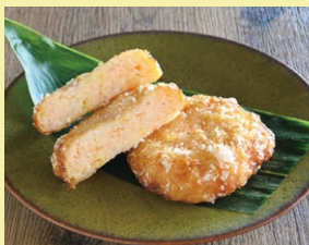
海老真丈 2枚 1,100円