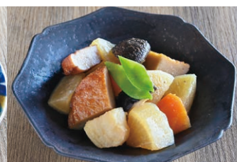
⑫さつま揚げと大根の煮物 (約2人前)