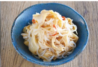
⑭湯葉筍と白滝のピリ辛炒め