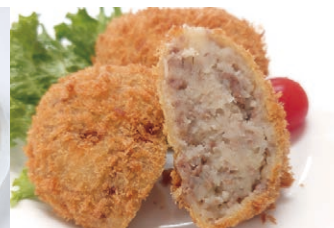
⑧自家製ポテトコロッケ (2個)