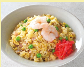
五目チャーハン 1人前 700円