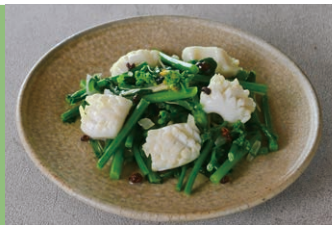
⑬イカと小松菜の山椒油和え