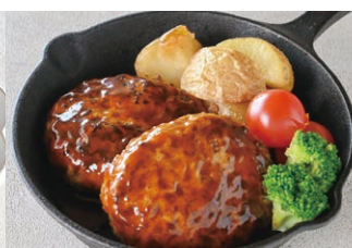
③ハンバーグデミグラスソース (2個)