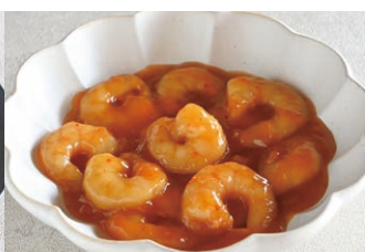
②海老チリソース (約2人前)