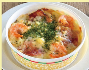
海老グラタン 1個 700円