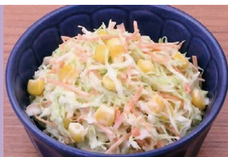
⑰コールスローサラダ