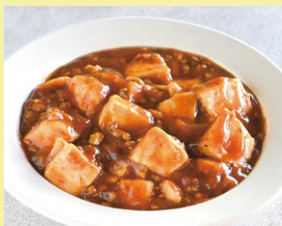
四川麻婆豆腐 1パック 700円