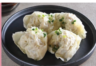
⑨海老入りワンタン (約2人前)