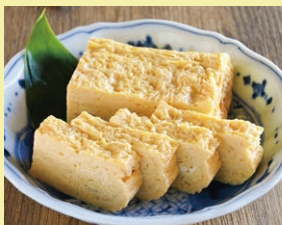
出汁巻玉子 1本 700円