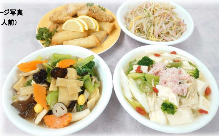
イメージ写真 (4人前)