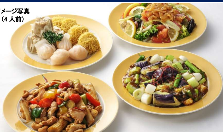
イメージ写真 (4人前)

オンラインショップから ご予約いただけます！ 新規会員登録で50ポイント &会員様はポイント1倍付与！