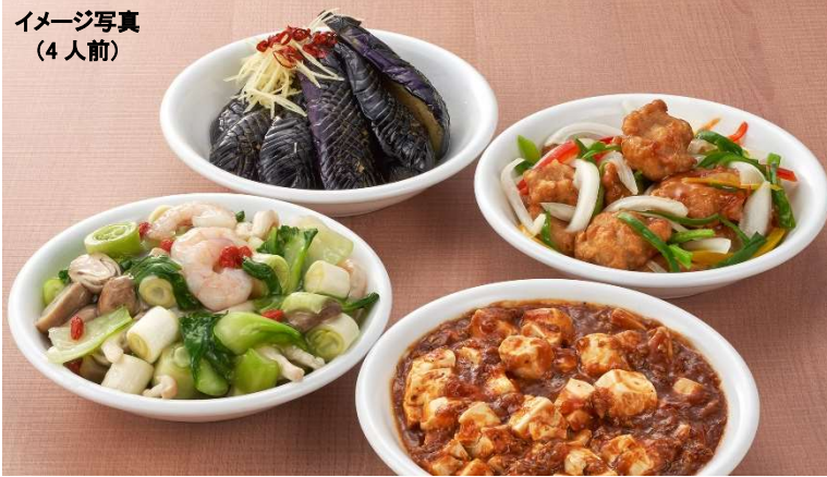
イメージ写真 (4人前)