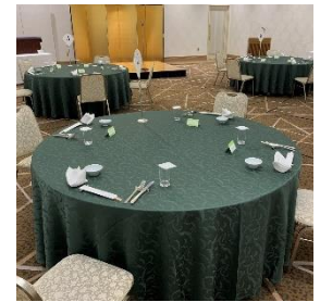
円卓は5～6名掛け、テーブル間は2m以上を基本としております

・サービススタッフおよびレセプタントは開宴前に検温を実施し、サービスの際はマスクを着用いたします。