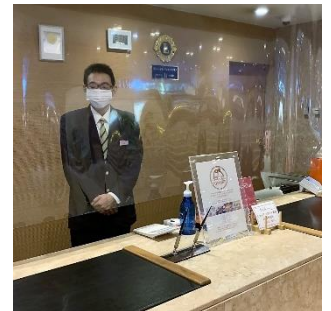
対面接客の箇所にはカーテン又はアクリルボードを設置しています