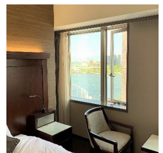
客室内の窓は開閉式で外気との換気が可能です

ご宿泊のご利用について、ご不明な点やご懸念等がございましたら、お気軽にお問い合わせください。皆様のご理解、ご協力を賜りますよう、何卒お願い申し上げます。